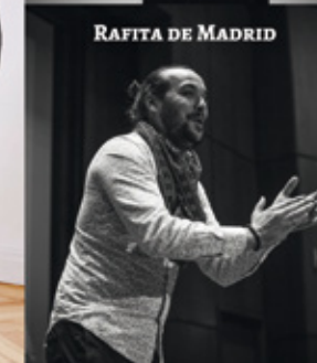
RAFITA DE MADRID

23:00 h. > Plaza Mayor Carretilla decorada simulando un ‘Toro de fuego’