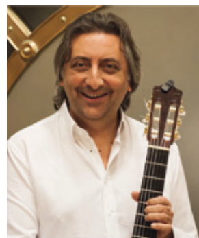
JUAN CARMONA (KETAMA)